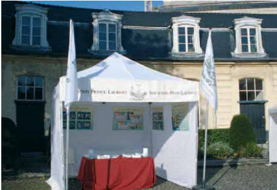
De stand van de Stichting, in de herfst van vorig jaar tijdens de dierendag in de Abdij van Terkameren