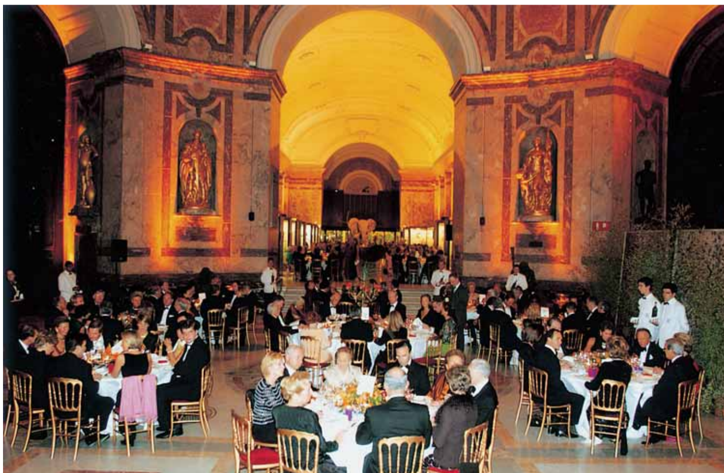
De grote zaal van het museum van Midden-Afrika dat werd gebouwd na de Wereldtentoonstelling van 1897, was rijkelijk versierd voor de gala-avond. Het hoogtepunt van de avond : een optreden aangevuld met het magische van de zaal.

Zijn werken kan men ook bewonderen in openbare verzamelingen : in het gebouw van de 'Assemblée nationale' in Parijs, het Europees Parlement of het Nationaal Fonds voor Hedendaagse kunst en in Franse en andere musea.