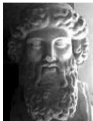
Plato (428 – 348 voor J.C.)

In 343 voor J.C. kreeg hij opdracht van Filips van Macedonië om aan zijn zoon, de latere Alexander de Grote onderricht te geven, hetgeen hem zou verplichten zijn onderzoek gedurende drie jaar op te schorten. Na deze taak keert hij terug naar zijn geboortestad om zich toe te leggen op de waarneming van huisdieren. Vijf jaar later vindt men hem terug in Pella, waar voortaan Alexander de Grote regeert. Hij sticht er een "Lyceum", een school waar hij zijn kennis doorgeeft aan zijn leerlingen. Naast zijn onderricht gaat hij verder met zijn wetenschappelijke werkzaamheden. Hij is voorstander van een systematische waarneming van de feiten en verricht talrijke secties en vivisecties. Deze werken werden door zijn tijdgenoten niet erkend en pas ten volle gewaardeerd in de 19de eeuw. Deze waarnemingen werden beschreven in meerdere werken waaronder "Het leerboek over de dieren" gewijd aan de vergelijkende anatomie en "De beweging der dieren". Bij de dood van Alexander de Grote verlaat hij Pella en sterft enkele jaren later, en laat verscheidene van zijn verhandelingen onafgewerkt achter.