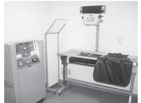
- De wachttijd van het dispensarium van Antwerpen - ... en de ontvangstruimte - De radiologiezaal.

Het aantal dieren dat in Antwerpen sinds de opening verzorgd werd, bewijst voldoende in welke mate het door de Stichting gestelde doel in de dagelijkse strijd tegen de onzekerheid van het bestaan werd bereikt. ■