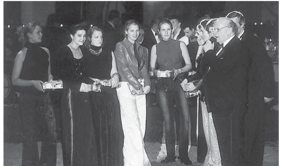
- Een heel bijzondere dank aan de jonge meisjes, dochters van bestuurders en vrienden van de Stichting, die de ganse avond, onvermoeibaar en met een nooit aflatende glimlach de biljetten van de tombola hebben verkocht. De opbrengst zal integraal gestort worden aan de dieren dispensaria van de Stichting. Hun volharding en doorzetting hebben bijgedragen tot het opmerkelijk resultaat van de prestigieuze tombola.

Hopelijk zal men, via een zo ruim mogelijke verspreiding van dit werk, de dierenartsen en beroepsmensen die met paarden omgaan, ertoe aanzetten om met deze vaststellingen rekening te houden, en zal men de nu nog bij de dierenverzorging gebruikte technieken voor de behandeling van paarden met stereotypieverschijnselen aan een kritisch onderzoek onderwerpen.