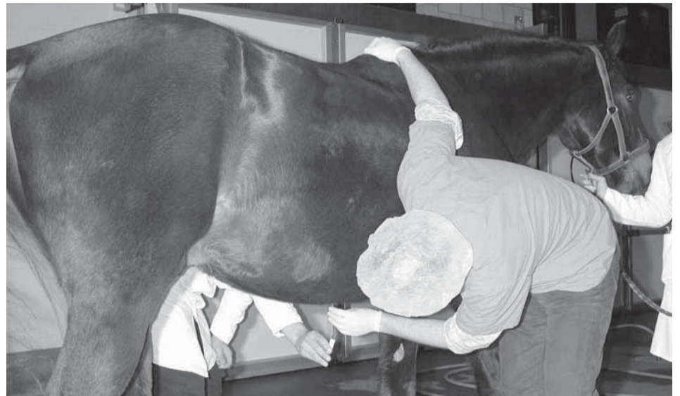
Wanneer een paard koliek heeft, is het voor de onderzoekende dierenarts vaak moeilijk te achterhalen of het dier een redelijke kans heeft een operatie te overleven.

Sommige situaties kunnen enkel hersteld worden door middel van een operatieve ingreep en dan dringt zich de vraag op van de prognose van deze operatieve ingreep. Een paard opereren voor kolieken houdt heel wat risico's in voor het betrokken dier, maar ook het prijskaartje is navenant. Prijzen van 2000 € vormen zeker geen uitzondering. Soms is het maagdarmstelsel dermate aangetast dat zelfs een operatieve ingreep geen oplossing meer kan bieden. In dergelijke gevallen zou men moeten kunnen vermijden dat een paard onderworpen wordt aan de lij-