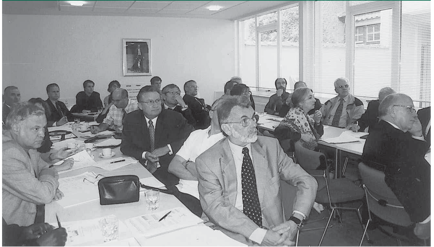
In de conferentiezaal van het Huis van de Stichting konden de deelnemers aan de plenaire zitting van het BPAM zich een idee vormen van de geboekte vooruitgang op het vlak van alternatieve methodes.