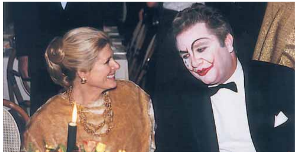
- Een onderonsje tussen Z.K.H. Prins Laurent en Prinses Alexander van België tijdens het diner.

gedelegeerd bestuurder, die tevens een balans opmaakte en sprak over de vooruitzichten van de Stichting. Hij verwees meer bepaald naar de oorspronkelijke doelstellingen; ten behoeve van de minst begunstigen in onze maatschappij is er een netwerk van dierendispensaria: 1 te Brussel, in een arbeiderswijk en 1 te Antwerpen, in de populaire stadsrand en 1 te Seraing. In deze dispensaria werden reeds meer dan 25.000 consulten uitgevoerd.