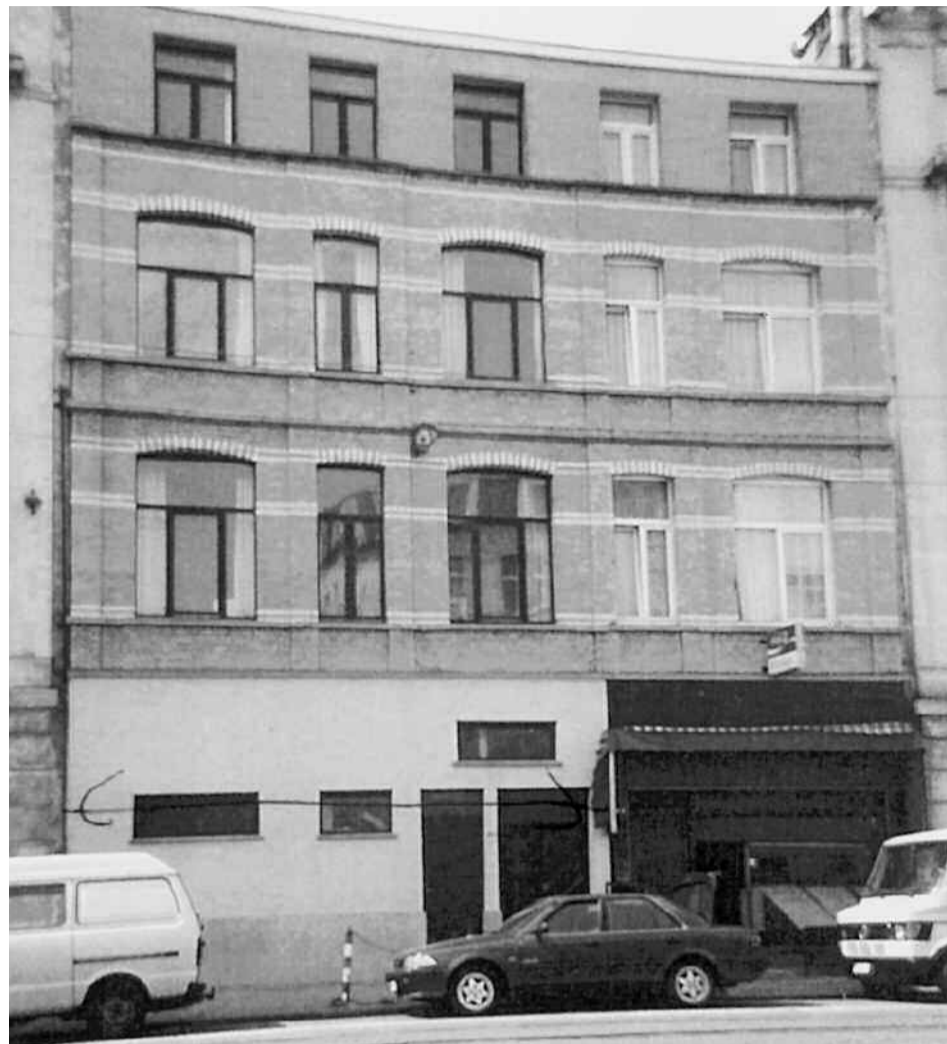
La façade du nouveau dispensaire d'Hoboken. Un bâtiment public cédé par la Ville d'Anvers.

faire soigner leur animal gratuitement, ne devraient pas avoir de raison d'être.