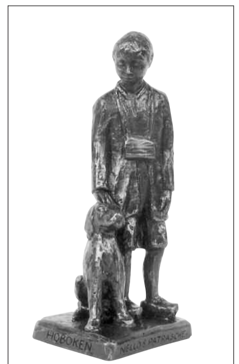
" Nello et Patrasche ", le petit garçon et son chien qui donneront leur nom au dispensaire d'Hoboken.

Souhaitons que ce nouveau dispensaire pourra très rapidement répondre aux besoins des plus démunis de la région anversoise, comme l'ont fait avant lui ses aînés de Bruxelles et de Seraing. ■