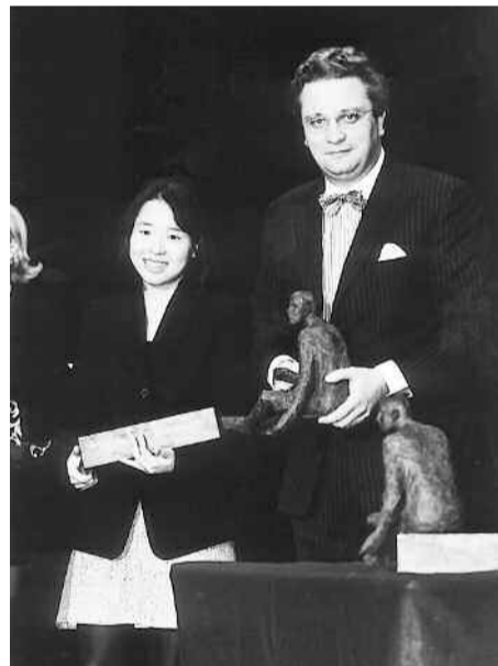
Le Prince Laurent remet un award, le 3 décembre 1997 à la créatrice de la seule SPA de Corée du Sud.

Les candidatures doivent parvenir le 15 août au plus tard au siège de la