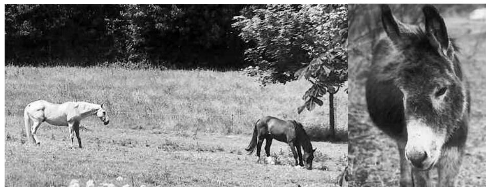
Cette année, le Prix sera consacré aux Equidés.

Fondation Prince Laurent (avenue P. Deschanel 36-38, 1030-Bruxelles) où peut être obtenu le règlement de l'attribution du prix.