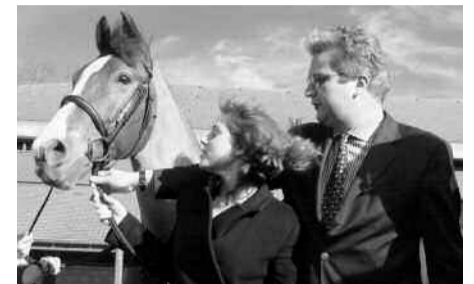
S.A.R. le Prince Laurent, Emilie Dequenne et Joli Cœur, le cheval asthmatique dont l'ERWF a décidé de s'occuper.

en Belgique ou à l'étranger, dans le but d'améliorer ou d'évaluer le bien-être des animaux.