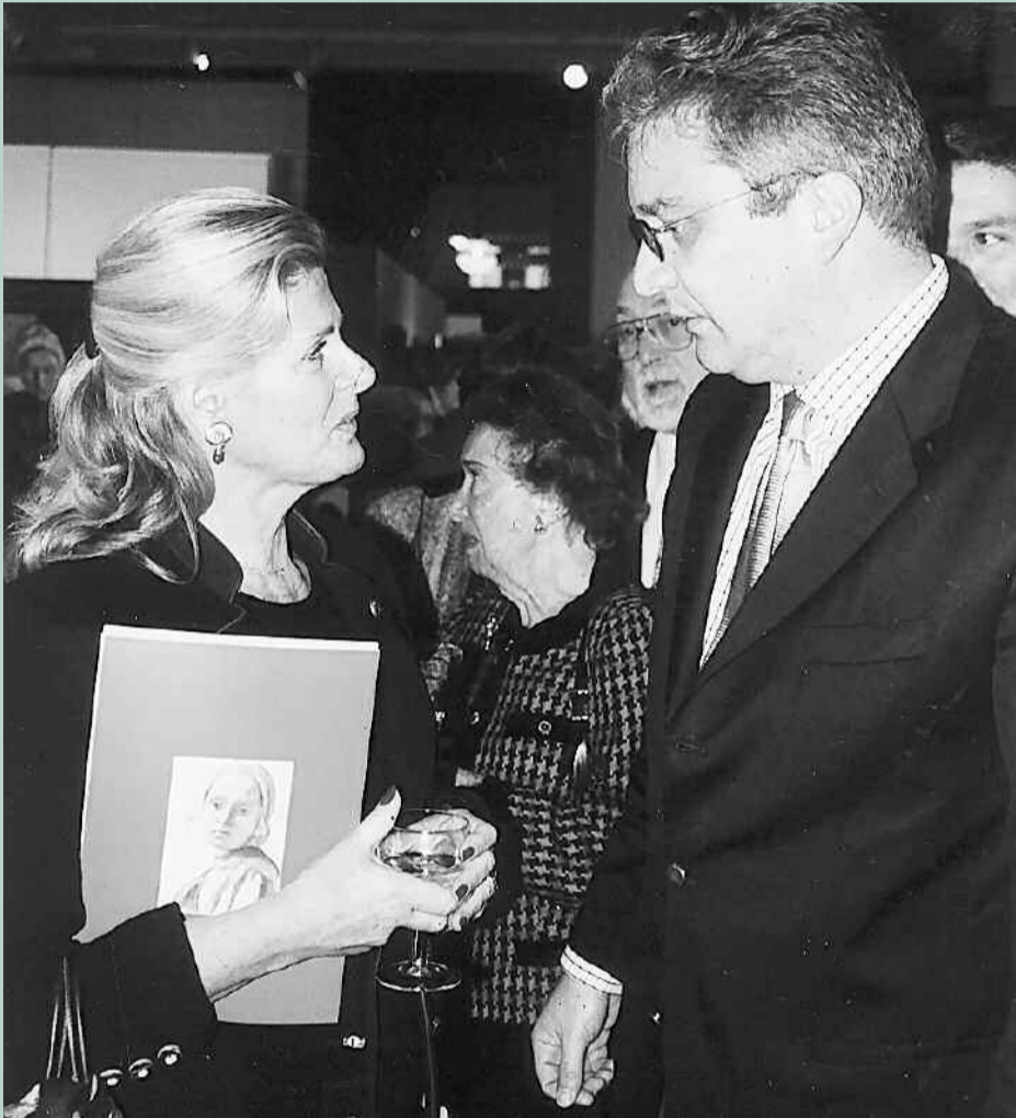
Le Prince Laurent en conversation avec la Princesse Léa de Belgique lors de la réception, à l'Hôtel communal de Schaerbeek