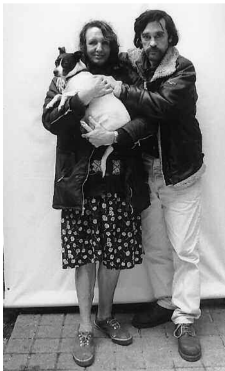
Au dispensaire de Bruxelles

Le succès des deux dispensaires de Bruxelles et de Seraing prouve à suffisance que de plus en plus de personnes se retrouvent dans le besoin (plus d'un million de personnes se situent au niveau du seuil de pauvreté dans notre pays). Ce succès est bien évidemment loin d'être un objet de satisfaction en soi car dans une société plus juste et plus équitable, de tels dispensaires, où les personnes disposant de très peu de revenus peuvent