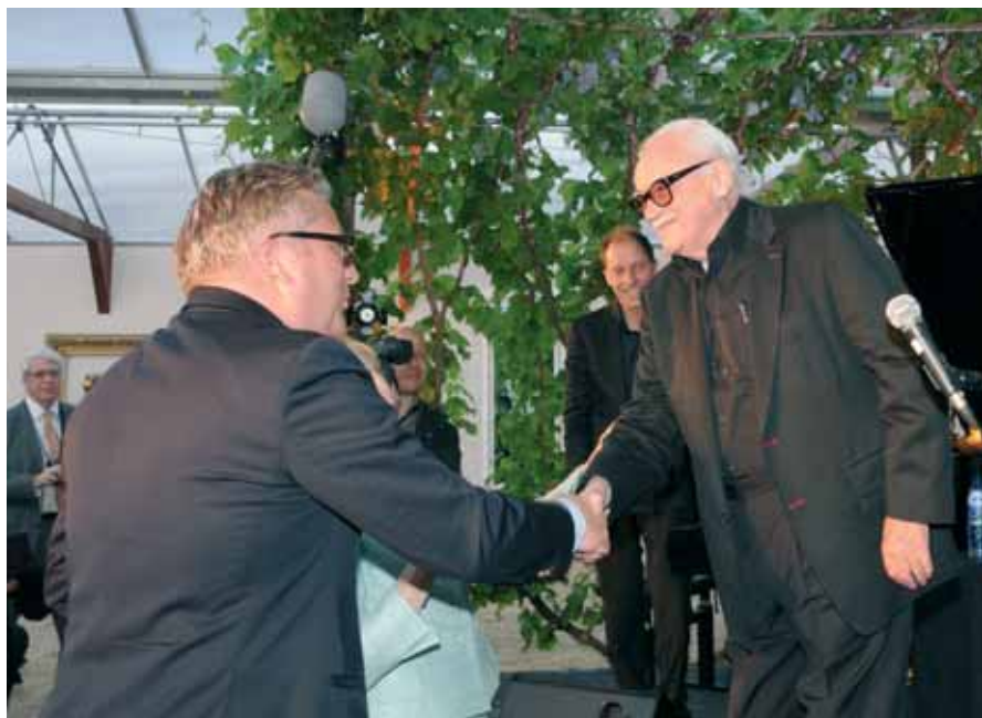
S.A.R. le Prince Laurent félicite Toots Thielmans à l'issue de sa brillante prestation.