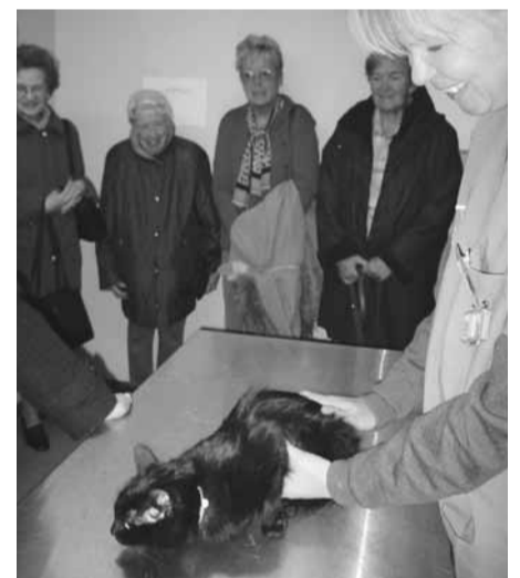
Le groupe des seniors, très attentif à l'examen d'un chat par l'une de nos vétérinaires.

dispensaires ne peut qu'aller dans le sens de les faire connaître davantage. ■