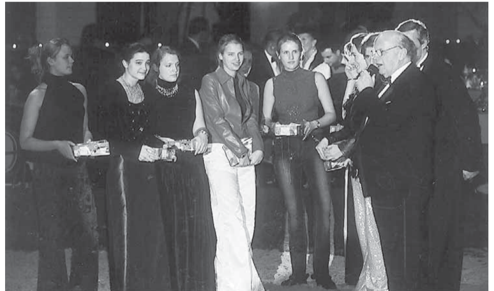
- Un tout grand merci aux jeunes filles des administrateurs et amis de la Fondation, qui, tout au long de la soirée ont inlassablement vendu, avec gentillesse et un sourire ininterrompu, des billets de tombola dont les bénéfices sont intégralement versés aux dispensaires vétérinaires de la Fondation. Leur acharnement et leur détermination ont permis de réaliser un profit remarquable pour cette tombola, au demeurant prestigieuse.

Souhaitons que la publication, la plus large possible, de ce travail puisse permettre aux vétérinaires et professionnels du cheval de reconsidérer les techniques de soins qu'ils apportent aux chevaux atteints de la stéréotypie de l'aérophagie.