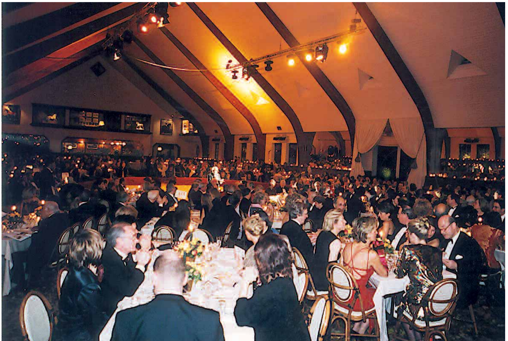
- De nombreux amis de la Fondation ont répondu présents à la soirée de Gala 2001. Quelque 500 personnes, dont bon nombre avaient revêtu une tenue de cirque, ainsi que souhaité sur l'invitation, se sont pressées dans le manège du domaine de Louvranges, transformé pour la circonstance en piste de cirque cernée par les tables des convives... Un endroit magique de l'avis unanime.

de la Clinique Saint-Jean à Bruxelles, qui permet à des patients proches de leur mort de revoir, dans l'intimité de leur chambre, l'animal qui a partagé les derniers mois de leur vie.