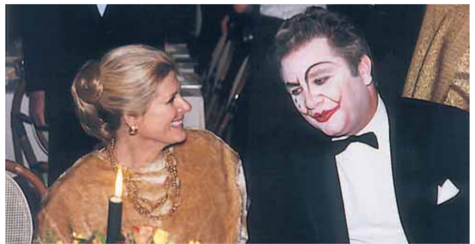
- Au cours du dîner, un aparté entre S.A.R. le Prince Laurent et la Princesse Alexandre de Belgique.

les perspectives de la Fondation, rappelant qu'elle a mis en place, pour les plus démunis de notre société, un réseau de dispensaires vétérinaires à Bruxelles (dans le quartier populaire de la place du Jeu de Balle), à Seraing (dans le quartier ouvrier) et à Anvers (dans la banlieue populaire), qui ont assuré plus de 25.000 consultations depuis leur création.