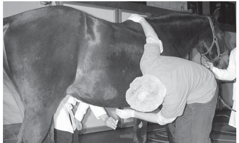
Ponction au ventre chez un cheval souffrant de coliques : l'analyse du liquide ventral fournit des indications sur le taux de lactate et permet un meilleur diagnostic en vue d'une intervention chirurgicale.

tion inutile et sans perspective aucune. C'est la raison principale qui nous a incités à trouver d'autres paramètres que le clinicien peut fournir sur la qualité du système gastro-intestinal d'un patient souffrant de coliques et soumis à l'examen du vétérinaire. En même temps, il importe de poser un pronostic pour le patient lors d'une intervention chirurgicale éventuelle. Il est apparu alors que le taux de lactate du liquide péritonéal constituait bien le paramètre recherché.