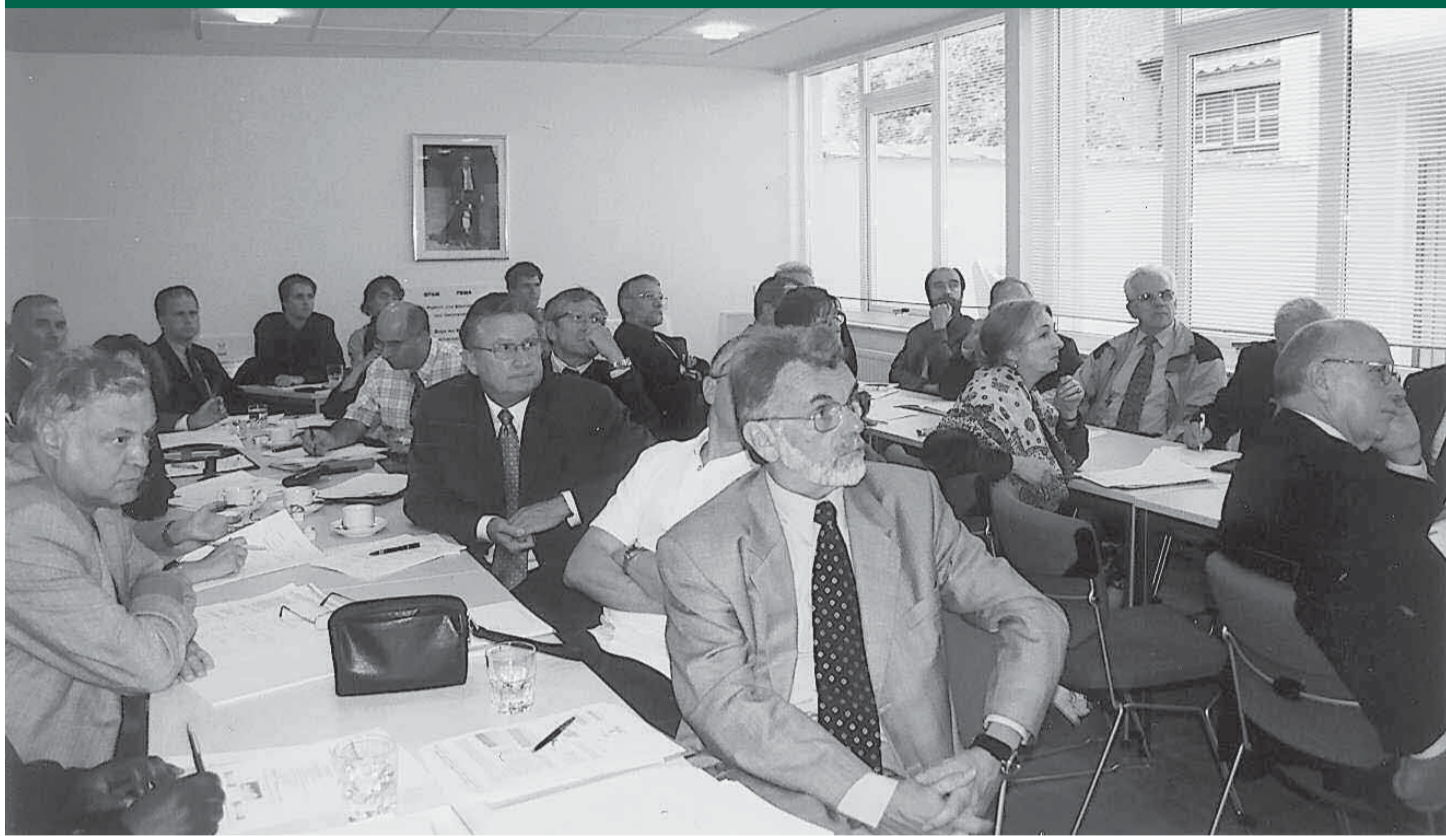
Dans la salle de conférence de la Maison de la Fondation, les participants à la séance plénière de la PBMA ont noté les progrès enregistrés en matière de méthodes alternatives.

C'est en présence d'une trentaine de personnes issues des milieux gouvernementaux, universitaires, de l'industrie pharmaceutique, du monde de la protection animale et bien évidemment de la Fondation Prince Laurent, que s'est tenue en septembre dernier au Siège de la Maison de la Fondation, la séance plénière annuelle de la Plate-forme belge des méthodes alternatives pour faire le point sur les projets et résultats atteints en matière de réduction de l'utilisation des animaux dans la recherche scientifique et dans l'enseignement universitaire.